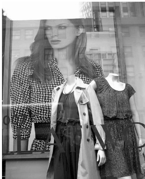
Slike: Banana rapublic gap clothing - Maulleingh

"While my heart is a shield and I won't let it down. While I am so afraid to fail so I won't even try. Well how can I say I'm alive"