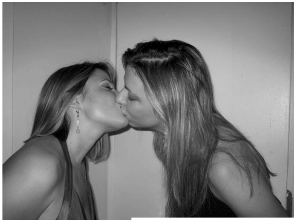
Slika: Girls kissing – Drdemento

Zelo zgodaj sem odkrila svoja nagnjenja. Ni me skrbelo, kaj bo, ker sem se zgodaj finančno osamosvojila in sem vedela, da lahko sama živim,