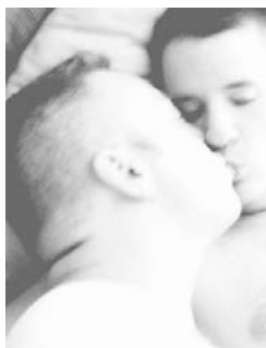
Slika: Soft kiss – Powerbook trance

»Kljub zgodnjemu spoznanju, da sem gej, sem naredil tako, kot je bilo za moje okolje sprejemljivo: se poročil in si ustvaril družino (imam sina, ki že ima družino). O svojem nagnjenju sem dolgo molčal, saj sem vedel, da se moram vdati v usodo, da ne gre drugače. Kasneje nisem več zdržal. Prek medijev sem ugotovil, da tema postaja aktualna in znana, da še zdaleč nisem osamljen primer, zato sem nazadnje zbral pogum in jima priznal. Žena je bila zelo šokirana, jezna, dejala je, da se počuti zlagano in izigrano, da sem ji uničil življenje ... Tega se zavedam tudi sam, ne bi je smel vpeljati v to. Je pa res, da sem jo kljub vsemu ljubil in to sem ji vseskozi poudarjal. Nazadnje se je le umirila, sam pa sem se še vedno počutil kriv. Zdaj imam že nekaj let partnerja (žena pred leti umrla za rakom). Seveda so ljudje kmalu izvedeli in seveda je